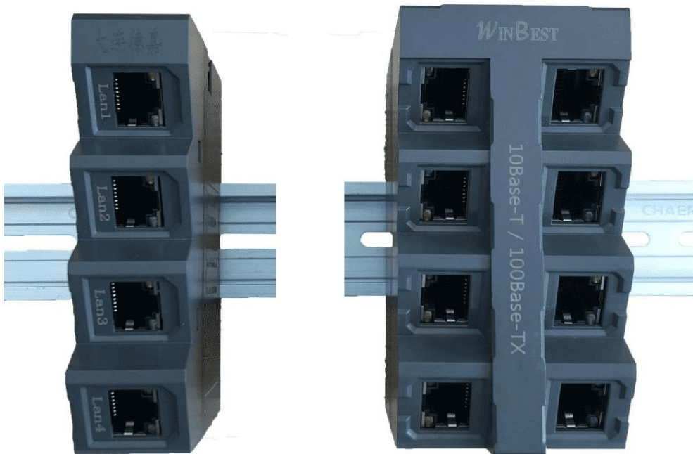
欧式四口工业交换机

Our new product: Industrial EtherNet Switch Unmanaged, 4x10/100 MBit/s Ports with RJ45 Sockets for Configuring Small Star and Line Topographies, LED Diagnostics, IP20, 24V DC Power, DIN-Rail Mounting